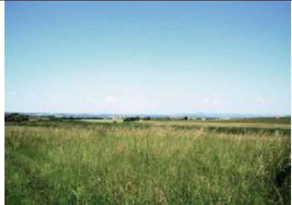
Západní část areálu v krajině, v pozadí Říp