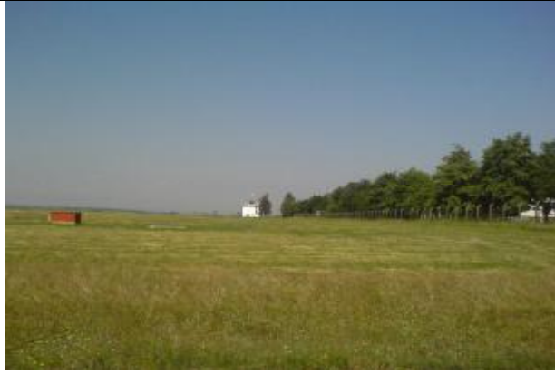
Severní okraj letištní plochy, vpravo stromy podél jižní hranice areálu závodu