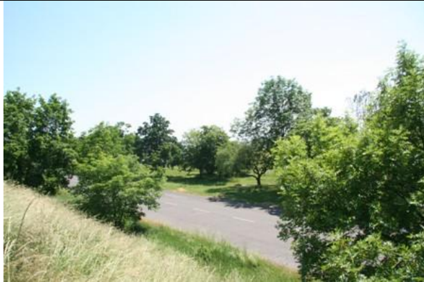
Pohled z navážek v JZ části areálu závodu k JV, dotčené porosty podél jižní hranice areálu závodu