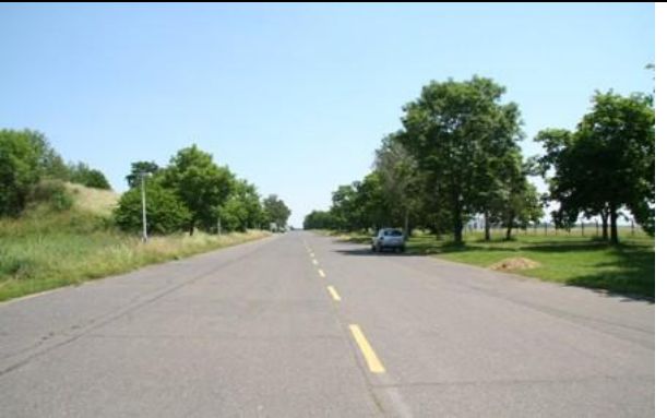
Dotčené dřeviny v JZ části areálu závodu u hranice s letištem