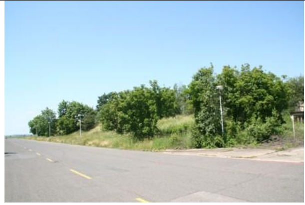
Navážky s xerofytními ladi v JZ části areálu závodu, prostory výskytu ještěrky obecné