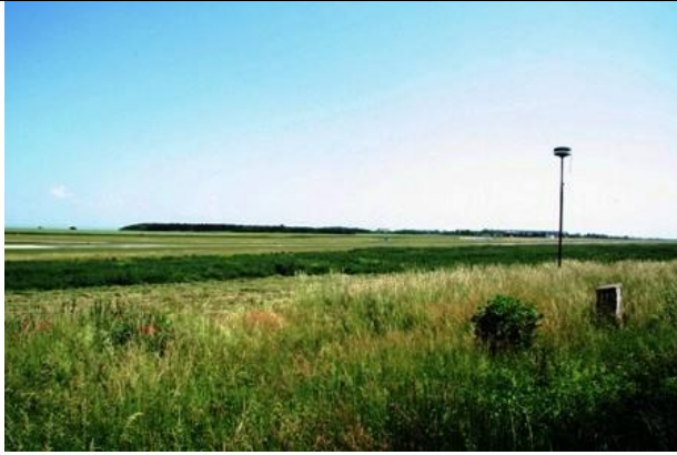
Celkový pohled na areál letiště od jihu