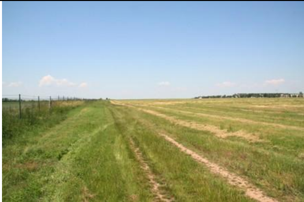
Plochy letištního areálu jižně od závodu