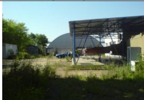
Urbanizované plochy v JV části závodu