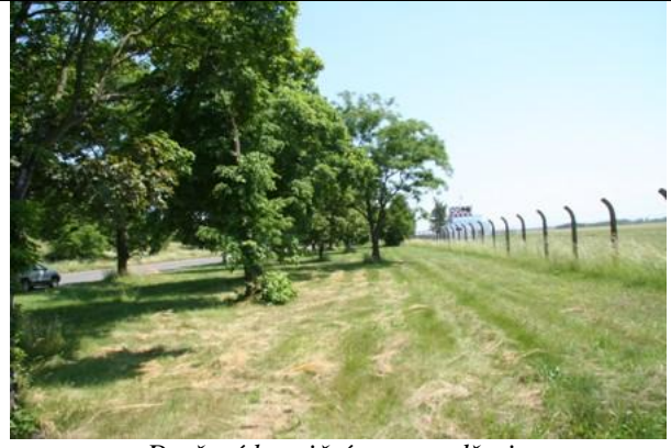
Dotčené hraniční porosty dřevin podél jižní strany areálu závodu k letišti