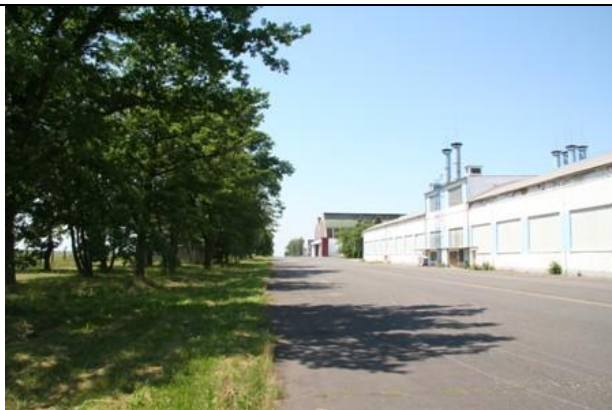
Střední část dotčeného pásu porostů