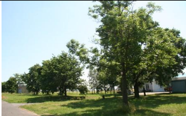
Detail střední části pásu dotčených porostů dřevin