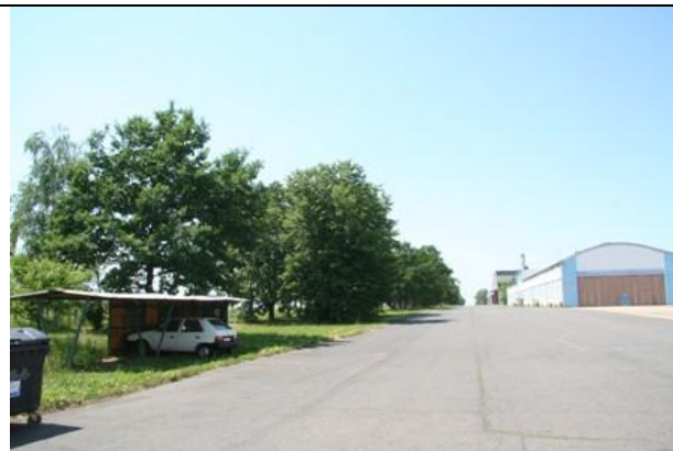
Východní část dotčeného pásu porostů

Foto RNDr. Milan Macháček, červen, červenec 2008