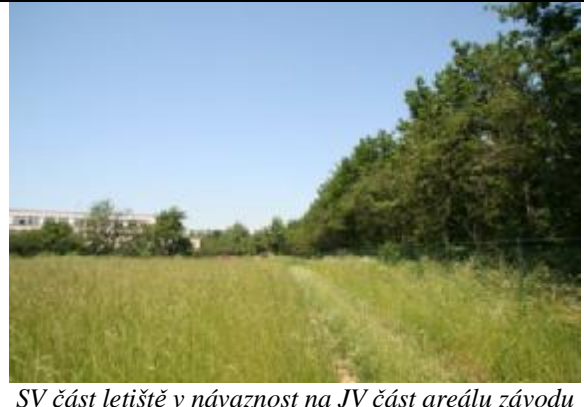
SV část letiště v návaznost na JV část areálu závodu Vodochod, plocha č. 1 porostů dřevin