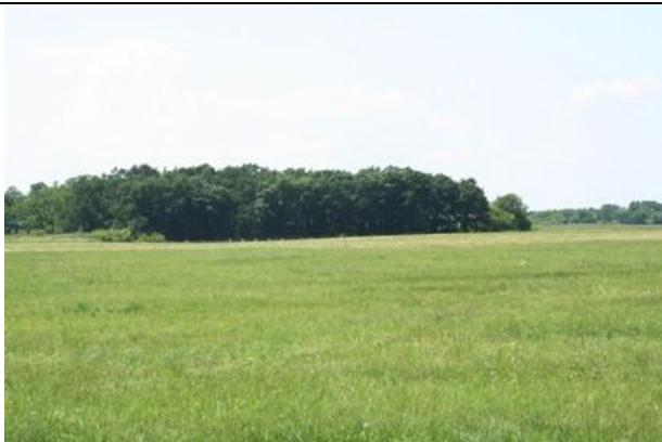
Lesík navazující na jižní hranici areálu letiště SV od Vodochod