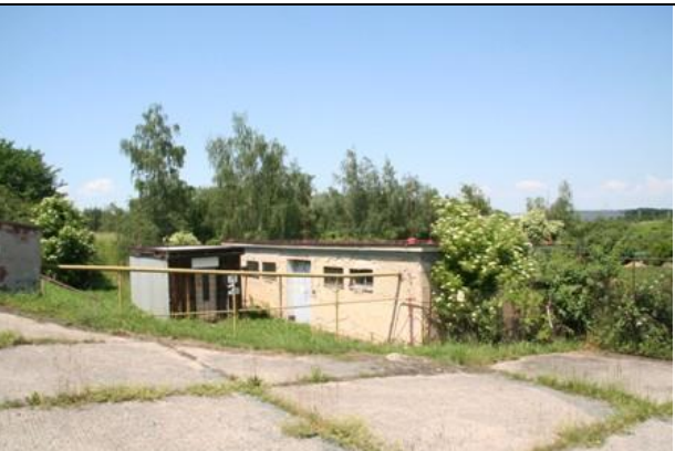
Ruderalizované plochy v západní části areálu závodu